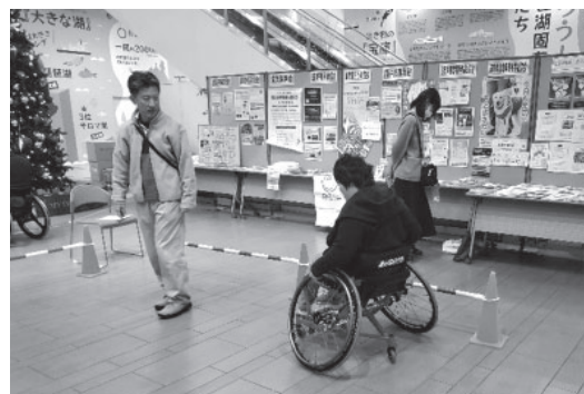
昨年度の様子(啓発イベント)

内容：・障害者団体や関係機関等の活動PR ・滋賀県障害者差別のない共生社会づくり条例の啓発 ・展示・体験コーナー 等