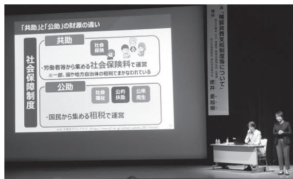
昨年度の研修会の様子