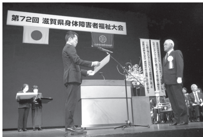
昨年度の式典の様子