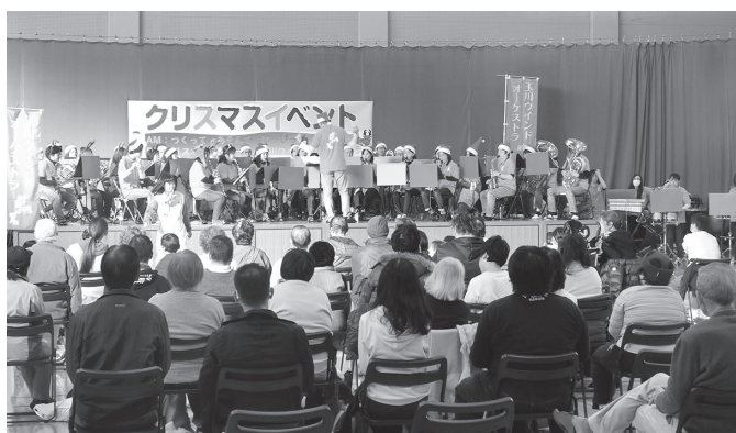
クリスマスイベント

〈第二部〉 コンサート ~玉川ウインドオーケストラ~ 曲目:クリスマスソング、J-pop等