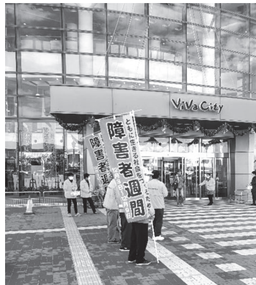
昨年度の様子(街頭啓発)